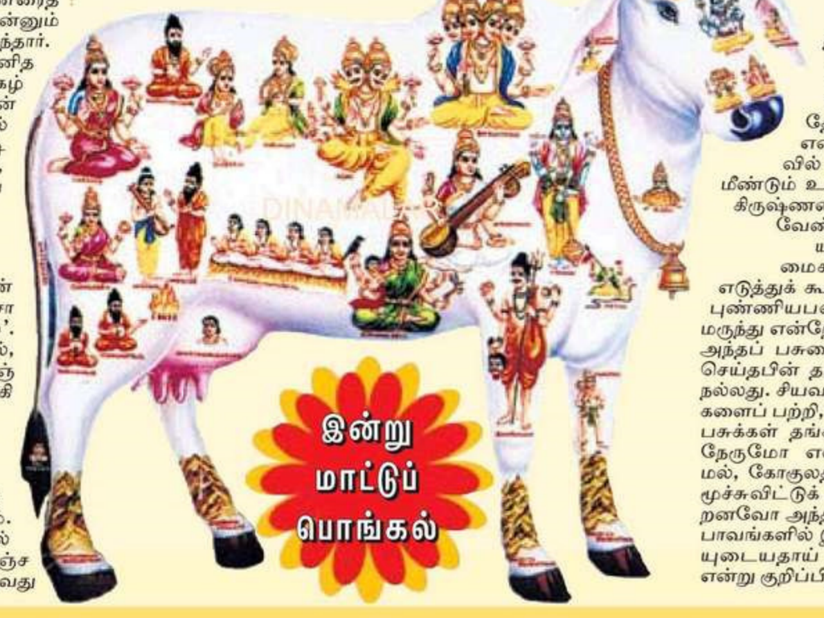
இன்று மாட்டுப் பொங்கல்

அப்பர் தேவாரத்தில் 'ஆவினுக்கு அருங்கலம் அரன் அஞ்சாடுதல்' என்று பாடுகிறார். 'ஆ' என்றால் பசு; 'அஞ்சாடுதல்' என்றால் "பஞ்சகவயத்தால் அர்ச்சினை செய்தல்". பஞ்சகவயம் என்பது பசுவின் மீது உண்டாகும் பால், தயிர், நெய், கோயில் (பசுவின் ஜலம்), கோமயம் (பசுஞ்சாணம்) என்னும் ஐந்து பொருள்களும் குறிப்பிட்ட விதிதாசாரத்தில் சேர்த்த கலவையே பஞ்சகவயம் எனப்படும். இதுதவிர, பாலர்ச்சினை, தயிர் அர்ச்சினை, நெய்யர்ச்சினை என்று தனித்தனியாகவும் சிவபெருமானுக்குச் செய்யலாம் உண்டு. திருவையாறு அருகிலுள்ள தில்லைத்தானம் என்னும் தலத்தில் இருக்கும் பெருமானுக்கு நெய்யர்ச்சினை சிறப்பாகும். தில்லைத்தானம் என்னும் இத்தலம் தேவாரத்தில் திருமெய்த்தானம் என்று குறிக்கப்பட்டுள்ளது. பஞ்சகவயத்தால் சிவபெருமானுக்கு அர்ச்சினைச் செய்யலாம்.